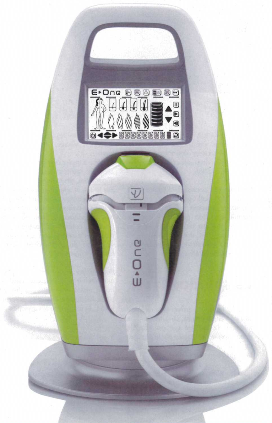
Le e-one - Prix : 1350 €. Disponible en 7 coloris (pastel ou flashy).

semaines environ. Une fois tombés, les poils ne commenceront à repousser que 40 à 60 jours après la séance. Au final, après 10 à 12 séances espacées de 2 mois, seules 1 à 2 retouches annuelles seront nécessaires pour conserver durablement une peau nette et douce. ■